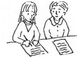
手書きノートテイク