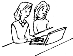
パソコンノートテイク